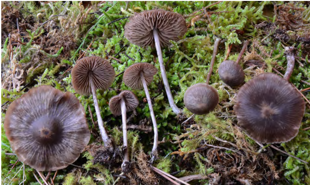
Entoloma occultripigmentatum Arnolds & Noordel.