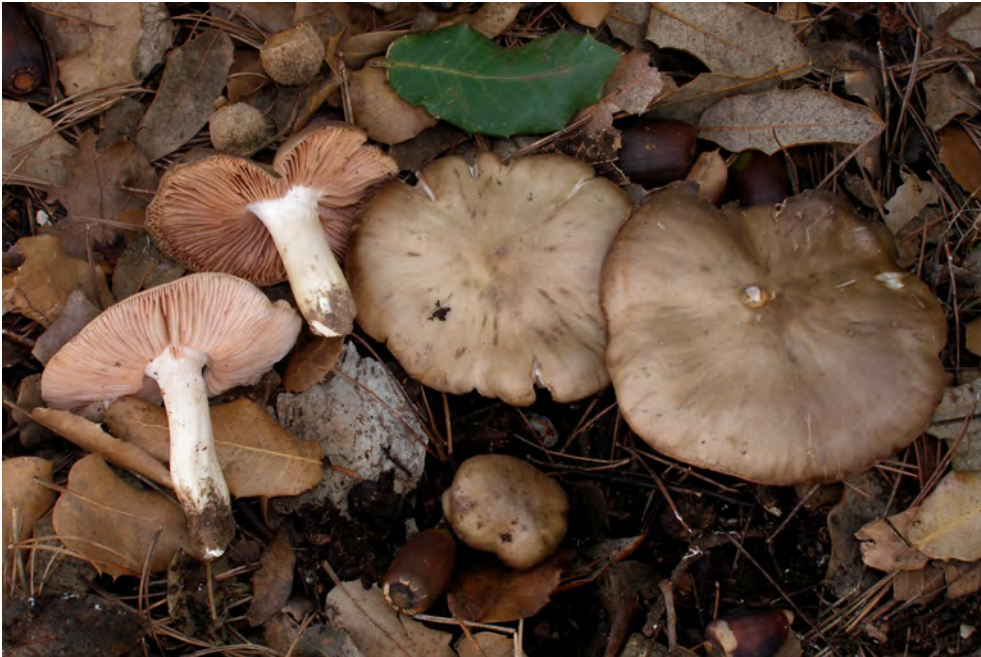
Entoloma ochreoprunuloides Morgado & Noordel.