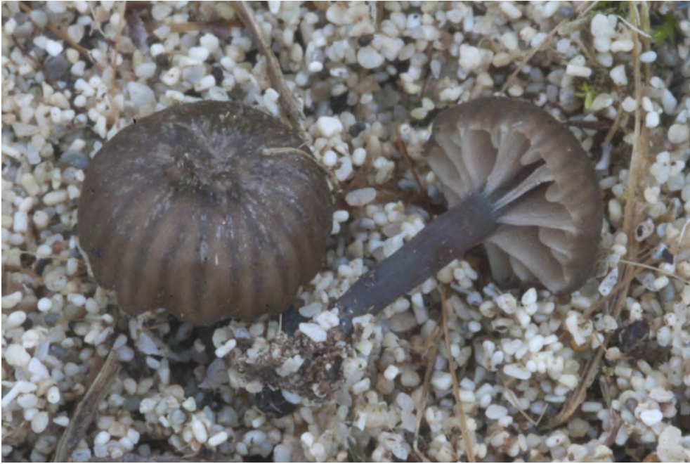
Entoloma phaeocyathus Noordel.