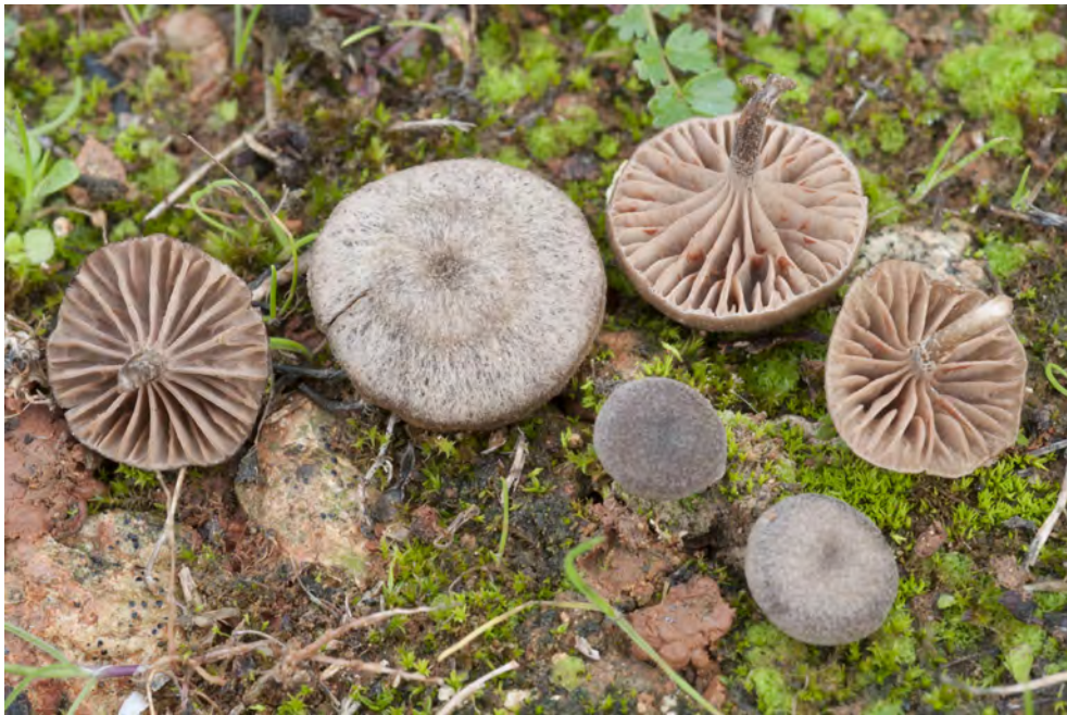
Entoloma flocculosum (Bres.) Pacioni