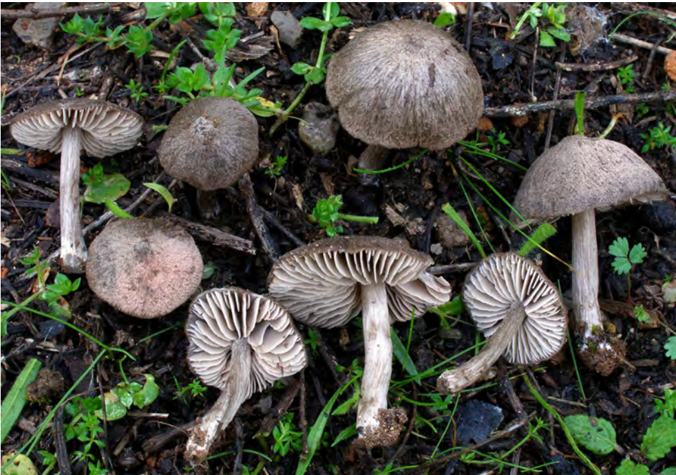
Entoloma resutum (Fr.) Quél.