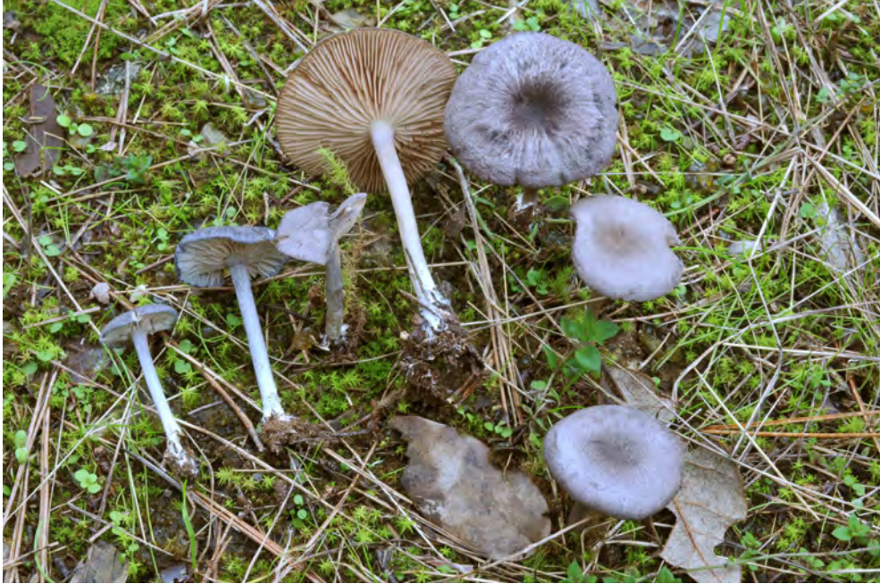
Entoloma mougeotii (Fr.) Hesler