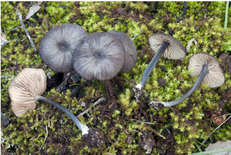
Entoloma serrulatum (Fr.) Hesler