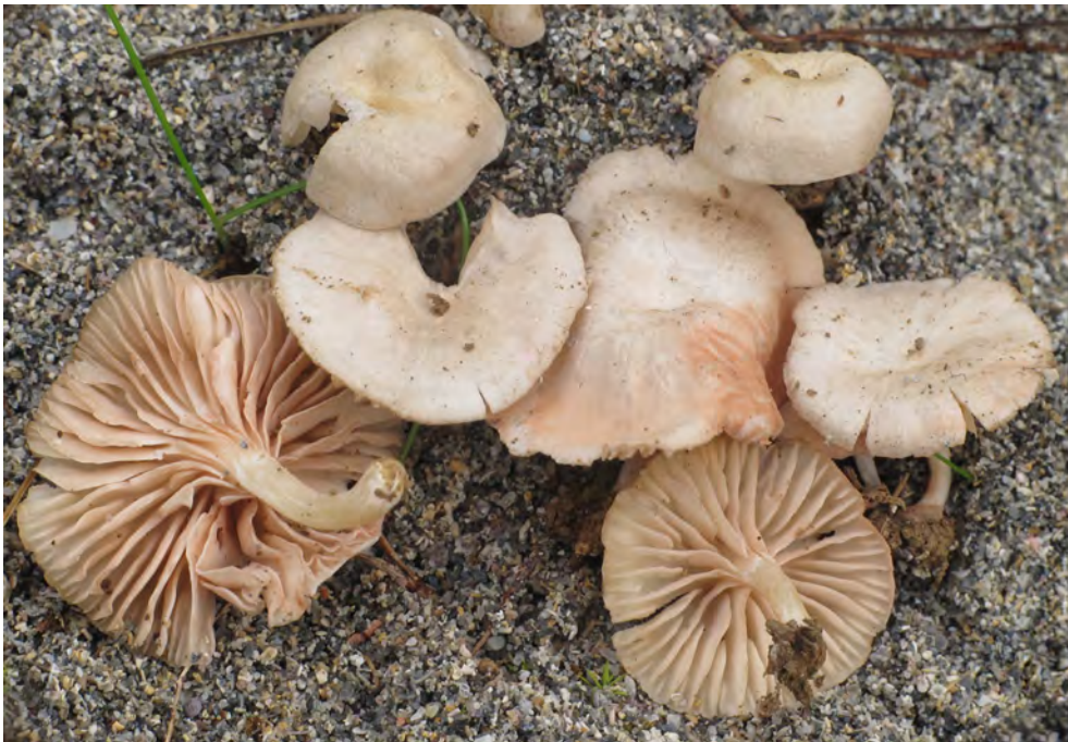
Entoloma pallens (Maire) Arnolds