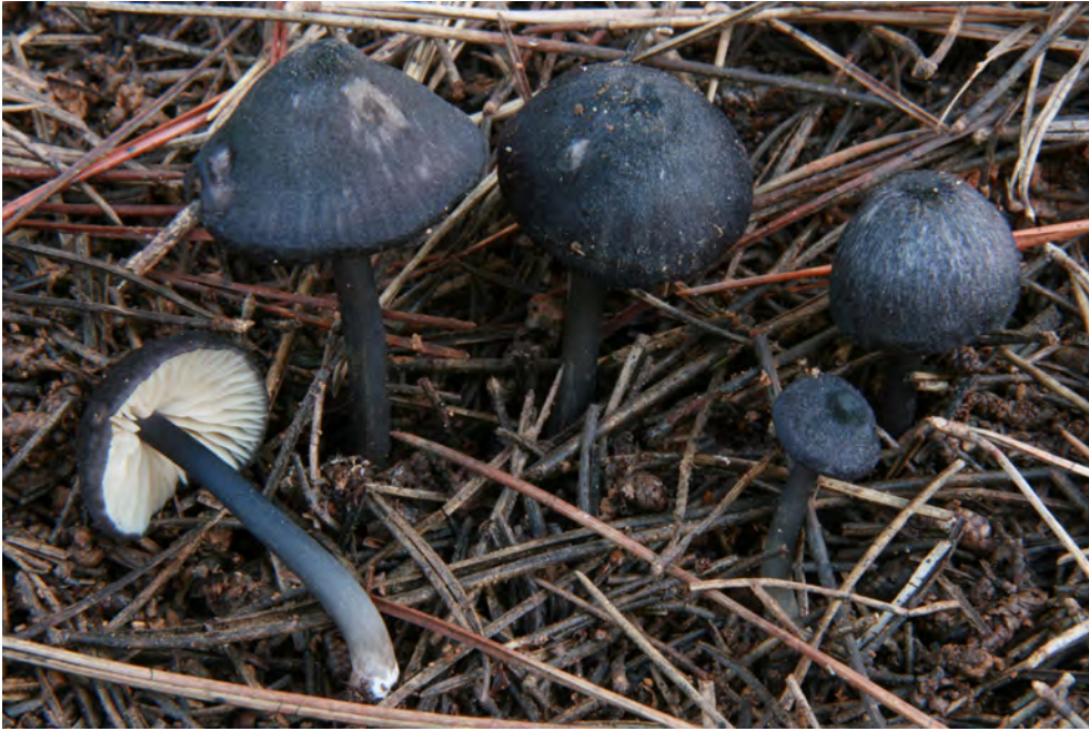
Entoloma caeruleum (P.D. Orton) Noordel