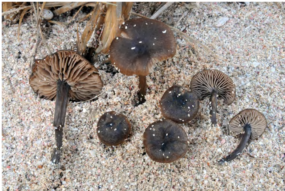
Entoloma undulatosporum Arnolds & Noordel.

OBSERVACIONS. E. serrulatum (Fr.) Hesler és una espècie que es pot reconèixer fàcilment pel color blau fosc del píleu i de l'estípit i per tenir les làmines amb l'aresta serrada i de color també blau fosc. De tota manera, la coloració del píleu és força variable, fins el punt que es pot arribar a confondre amb espècies pròximes. D'entre els Entoloma amb l'aresta de les làmines tenyides (grup E. serrulatum ) hi ha E. querquedula (Romagn.) Noordel. que té tons olivacis tant al píleu com a l'estípit, E. caesiocinctum (Kühner) Noordel., que es diferencia per tenir el píleu de color bru i estriat per transparència, E. violaceoserrulatum Noordel., en el qual tant al píleu com l'estípit són de color violeta i E. brunneoserrulatum Eyssart. & Noordel., que té la morfologia d' E. serrulatum (Fr.) Hesler, però es caracteritza principalment per tenir l'aresta de les làmines tenyides de color brunenc. E. serrulatum (Fr.) Hesler és molt proper també a E. gomerense Wölfel & Noordel., però aquest té el píleu completament estriat per transparència i l'aresta de les làmines heteromorfa, amb presència de queilocistidis i basidis a la vegada. Primera citació a Menorca y noves localitats a Eivissa i Mallorca.