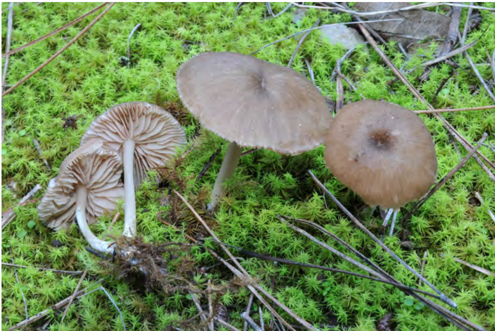
Entoloma longistriatum (Peck) Noordel.