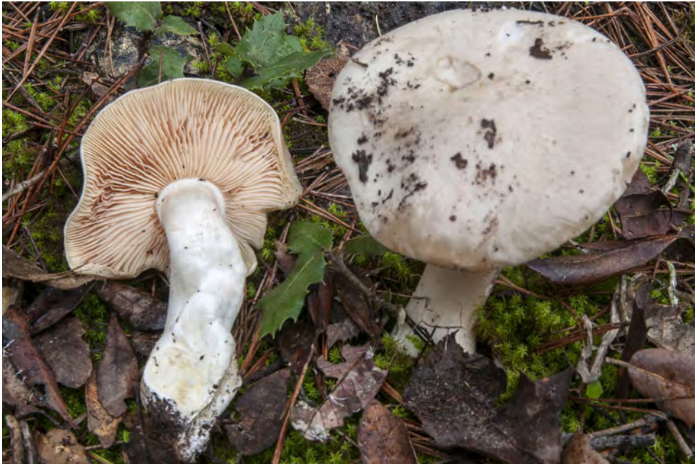
Entoloma lividoalbum (Kühner & Romagn.) Kubicka