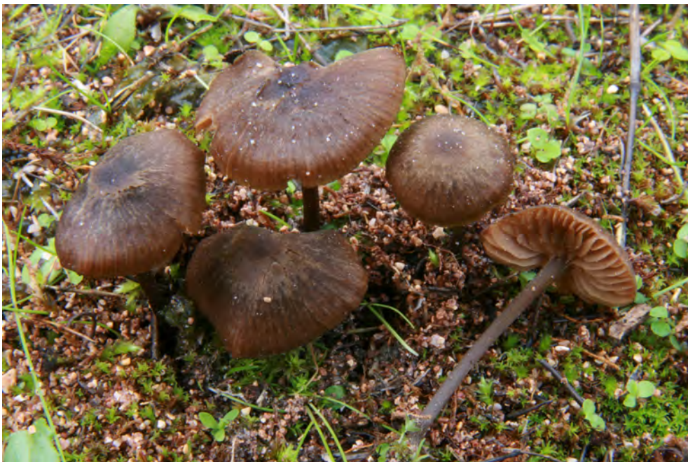
Entoloma juncinum (Kühner & Romagn.) Noordel