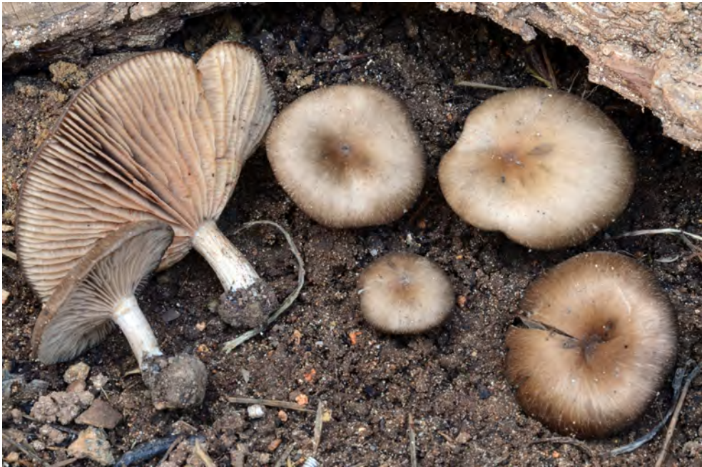
Entoloma sericeoides (J.E. Lange) Noordel.