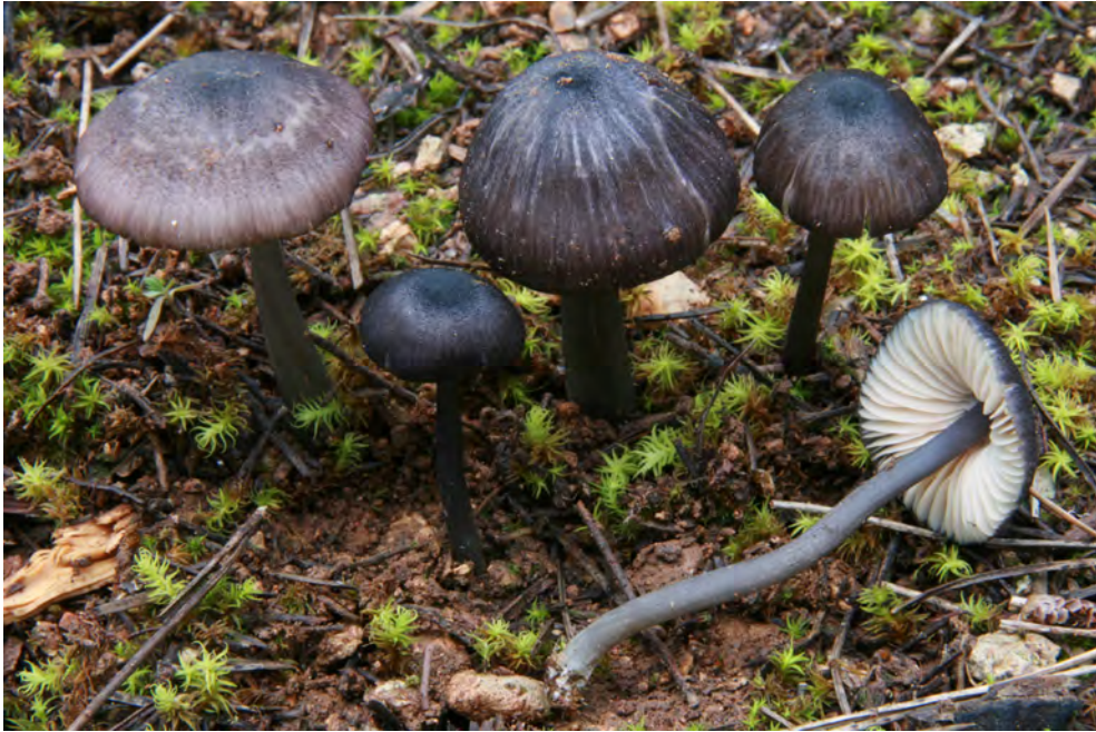
Entoloma atrocoeruleum Noordel.