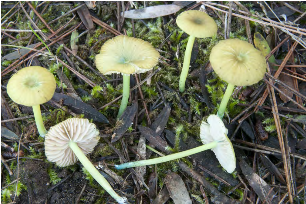
Entoloma incanum (Fr.) Hesler