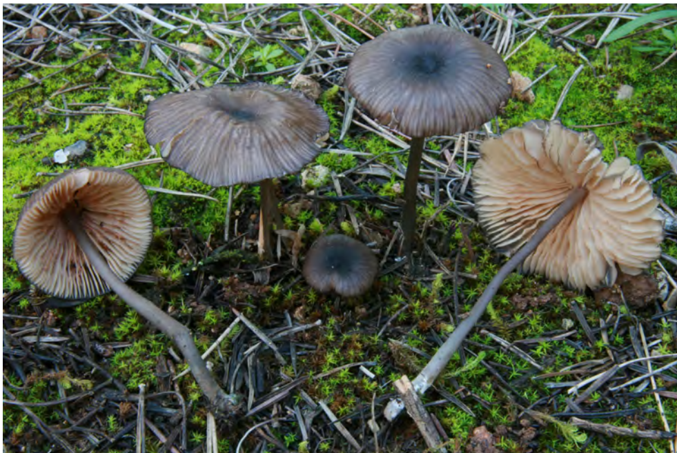
Entoloma brunneoserrulatum Eyssart. & Noordel.